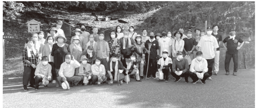
沢山参加ありがとうございました