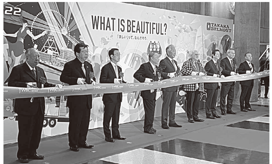
盛大なオープニング

タカラベルモント創業100周年の記念イベントがパシフィコ横浜で11月21日・22日の2日間 盛大に開催されました! 全国からたくさんのお客様が集い、ヘア業界関係者が集い、ヘアショー ビジネスセミナー 展示ゾーンなどあり、これからの業界発展の為の有益な情報満載なイベントでした。 (県広報 福江成江)