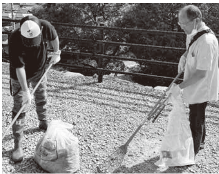
どんどんゴミが集まっています

暑い日差しの中での清掃活動となりましたが前年度は皆さん集まったので活動が出来なかった為、やはり大