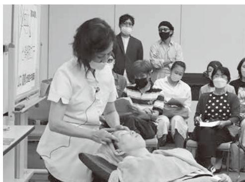
実際に剃っていただきました