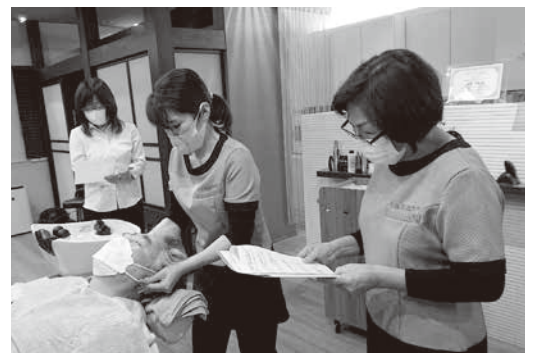
モデルにとっては至福の時間