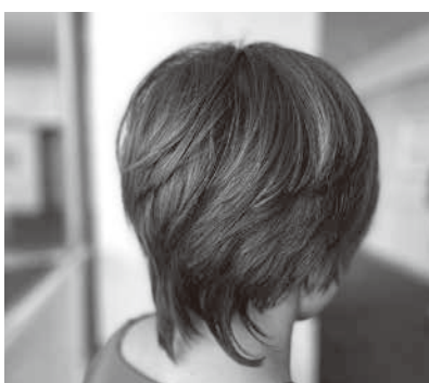
YELLですっきりいい感じ