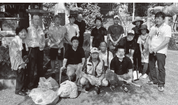
暑い中頑張りました