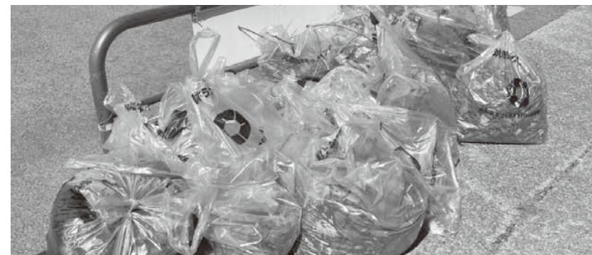
こんなに集まりました