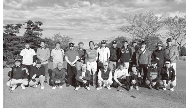
さあ、今から競技開始!