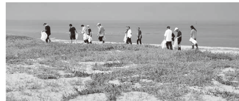
気持ちよく観光に来て下さい