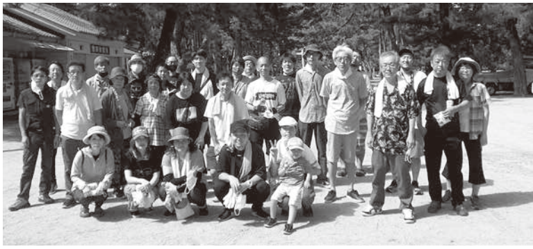
快晴の中楽しく出来ました

が落ちている海岸沿いの公園で、9月とはいえ残暑厳しい中、汗をかき清掃しました。ボランティア募金箱にも各支部より善意が寄せられました。皆さん笑顔でお昼前まで清掃活動に取り組んでいただきました。