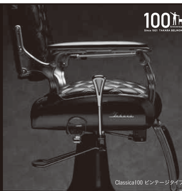
Classica100 ピンテージタイプ