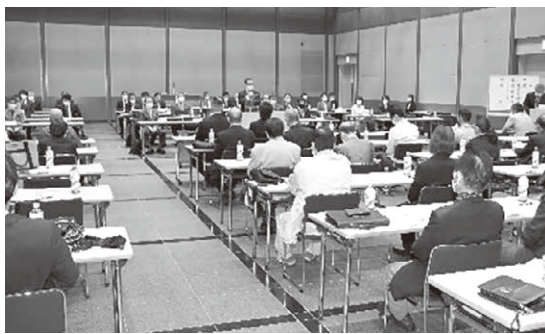
県総会・総代会の様子

引き続き総代会開催となり、総代総数五十五名の内出席四十名、委任状出席十五名、欠席一名により本会議は成立したとの報告があった。