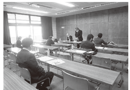
三密にならない総会の様子

琴平支部も組合員の減少に加えコロナ禍による組合員との交流減少など総会でも重苦しい議論が展開されましたが「小さいけどまとまる琴平支部」が当支部の伝統と支部