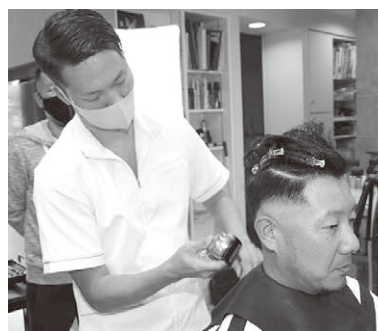
テキスト用撮影風景その2