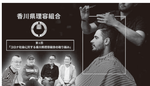
香川県理容組合公式チャンネル登録をお願いします