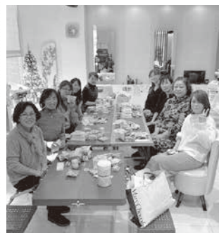
お楽しみの懇親会