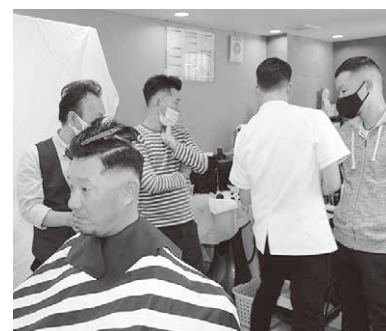
テキスト用撮影風景その1

二回目は「現代社会におけるツーブロック問題」校則で禁止されているツーブロックが何故いけないのか？本質に迫る社会的問題に取り組みました。このときには同時進行でフェードカット班もフェードスタイルの設定に毎晩のように会議を重ねて、出来上がった「香川発信フェードカットスタイル」今回皆様に直接講習にてご覧に入れられないのが非常に残念な程、素晴らしい出来映えです。これをなんとか組合員の皆様にお伝えしな