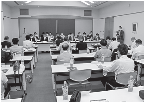
共済打ち合わせ会の様子

県独自の推進キャンペーンでは、ワイドプラン・団体生命小型・療養補償(所得・医療コース)を重点共済としました。特にワイドプランは加入者が極端に少ないので力を入れて推進して参ります。と言うのも、昨年の関東を襲った台風十五号、十九号の恐ろしさは、まだ記憶に新しく、また今年の梅雨時期における熊本県を始めとする九州の豪雨被害を目の当たりにするとワイドプランへの加入推進は特に必要だと痛感しました。ですから打ち合わせ会では各支部の支部長並びに