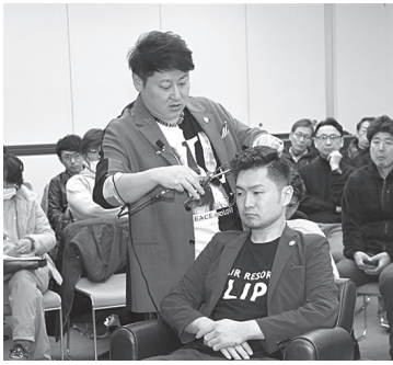
先生のコテパー技術に興味津々

今年最初の県講習は平成三十一年一月二十一日(月)にサンメッセ香川にて、なんと世界チャンピオンの佐藤秀樹講師をお招きし、匠の技を思いっきり披露して頂きました。 佐藤先生と言えば言わずと知れた田中トシオ氏に師事し、2008年シカゴ大会金メダルをはじめ、ここに書ききれないほどの世界大会金メダルを受賞しているまさにチャンピオンの中のチャンピオンです。 現在では自身のお店「ヘアリゾート・クリップ」を九店舗展開する凄腕経営者でもあります。さらに今年は十店舗目も計画とのこと。技術者としても、経営者としても大成功を収めています。 今回は世界トップの技術を間近で見られるという貴重な機会ということで、いつもよ