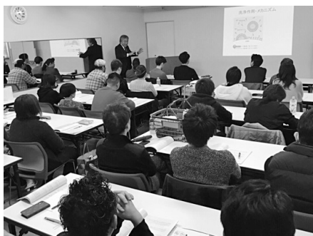
座学でシャンプーの基礎知識

各地区の講習を受講し、より詳しくマイスターを目指すための講習「シャンプー&セットマイスター認定講習」が平成三十一年二月十八日(月)にタカラベルモント高松スタジオで開かれた。講習時間は約六時間の長丁場にもかかわらず、定員いっぱい三十名が集まった。