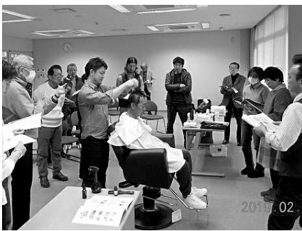
西讃協議会、シャンプー技術の実習