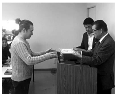
マイスター認定証の贈呈

に終了した。マイスターに選ばれた方々は、理容技術の伝承、後進の育成などにご協力ください。(県広報 小松芳浩)