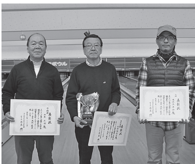
上位入賞の皆さん

らうためのSMSの効果的な使い方や外国人が来店時に効果のある多言語翻訳アプリ「Voice TRA」の使い方などを教えてもらった。 また、この講習受講者は、店舗検索サイトに登録することになっており、外国人にわかりやすく店舗情報やメニューを公開することになっている。 今後は、日本の理容技術の素晴らしさを多くの人に知ってもらい、いつ外国人客が来てても対応できるよう、我々も準備して、理容体験が来日動機になるくらいに浸透していければと思う講習会であった。 (県広報 小松芳浩)