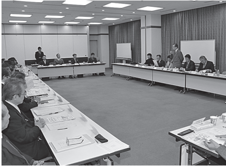
第四回理事会理事長あいさつ

議事進行に入る前に、低周波治療器「サンマッサー」でおなじみの丸菱産業より新機種を紹介があった。組合員には特別価格でお求めやすく、各支部に