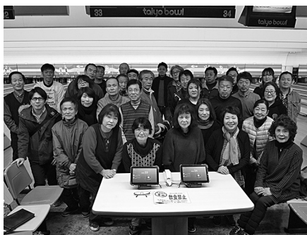
参加者全員で記念写真

そんな感じでいつもより盛り上 がり、大変和気あいあいとした楽 しい大会となりました。 結果は小豆島勢がとても頑張