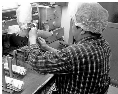
完成に近づく胎毛筆

一日目は大和ミュージアム、光文 堂、竹原町並み散策、湯坂温泉。二 日目は耕三寺、大山祇神社、来島 海峡の渦潮を巡りました。久しぶ りに朝からアルコール漬けで、とて も楽しい二日間でした。