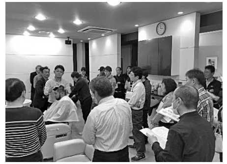
多くの参加者で大盛況

だと再認識できました。 セットは白井講師担当で、皆さん少なからず興味のある「ドライソンドライヤー」をはじめ、色々なタイプのドライヤーの紹介をしながらセット理論と実技をして頂きました。 知っているようで忘れていたことも多々あり、きちんと出している技術することで低料金サロンとの差別化も出来るし、高料金を頂けるマッサージメニューも作れそうだと思いついた後のサロンワークが楽しみなった講習でした。 (県広報 山崎鎮永)