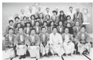
草津 ホテル櫻井にて