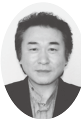
教育部長 御園善章氏