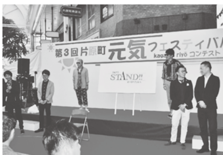
「STAND!!」のデモンストレーション