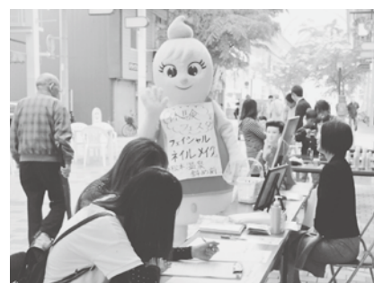
街頭で実演教室開催