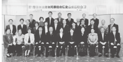
円滑に進行した仏生山支部総会