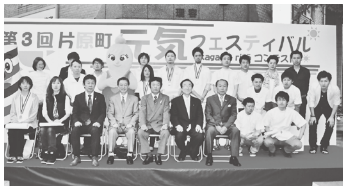
各部門の出場選手