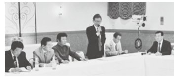
西讃協議会役員総会

平成二十五年 西讃協議会役員総 会が、五月十二 午後六時より、時 折強く降りつける 風雨の中、観音寺 市の翠明殿で、執 り行われました。