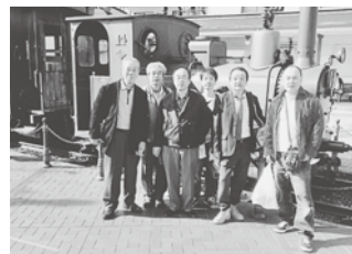
坊ちゃん列車の前で

を十分に ご審議い ただき、 すべてご 承認いた だきまし た。その 後、香北 支部のこ れからの