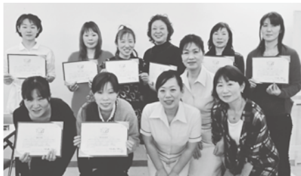
受講修了証を手に大満足！

やってみると、みんな手付きも良く、スムーズに進む事が出来ました。二日目は午前中から実技に入りましたが、二回目と言う事で、みんな要領よく、最後の通しでの練習では、モデルの人から寝息が聞こえるほどの上達でした。八名の受講者は、みんなメニュー化する事に意欲的で、その思いが伝わってくる、二日間の講習でした。講師の