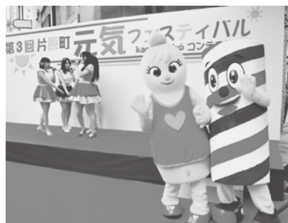
きみともキャンデーとパーパーくん&シャンプーちゃん