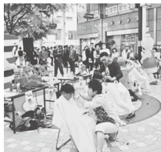
キッズヘアコンテスト会場(片原町)