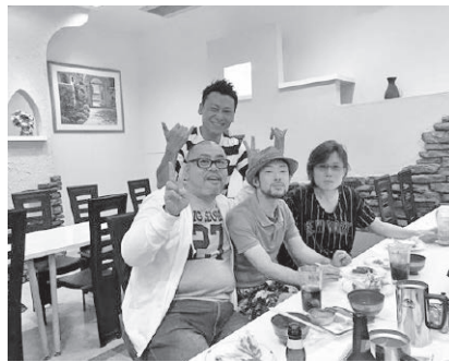
ほろ酔いで盛り上がってます！

猛暑が続く七月二十日、西讃地区の組合員仲間が集まり釣り・バーベキューを楽しむ夏休みの子どもたち。一人のお父さんが大きいスイカを抱えてきました。なかなか立派なスイカ。バーベキューも盛り上がり、スイカの時間となった頃、一本の長い棒とタオルが用意されスイカ割りが始まりました。ぐるぐる回された子供がスイカを叩いたか、大きい台を叩いたか、さだかではありませんが、笑い過ぎた一日となったのは間違いないようです。私も子供の小さかった頃を思い出しながら、月曜日の楽しい一日が終わりました。 (県広報 森 健二)