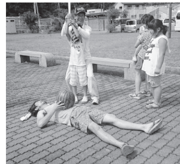
よい子はマネしないでね！