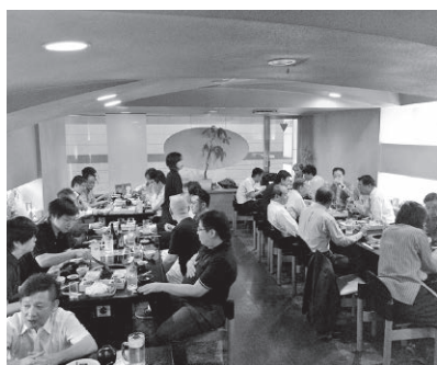
和やかな雰囲気の中で懇談中