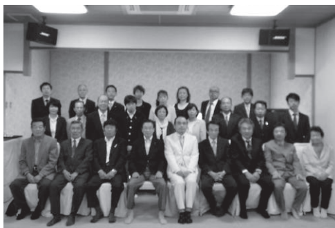
新たなメンバーも加入!

りました。三年間の任期中、みんなで協力し、精一杯頑張っていこうと心新たにスタートを切った総会となりました。