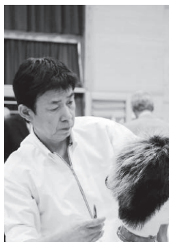
第4部門 北地 一行 選手