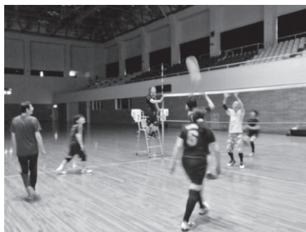
ソフトバレーで楽しくストレス解消

平成二十七年年度、中讃ソフトバレー親睦会が、七月六日普通寺市民体育館にて開催されました。最近バレーをする組合員さんが減り、今年も順位をつけずに、楽しくやろうという趣旨で行われました。一セット二ゲームでやるならくじのチーム分けに、もう少し時間をかけて、各チームの戦力を均等にしたいほうが、楽しめるような気がしました。今回終了した時点で、一時間ほど時間が余ったので、この辺は来年の課題ということにしたいと思えます。大会自体は、参加者のみなさん、日頃の運動不足も解消でき、和気藹々十分楽しめたようです。来年はもう少し