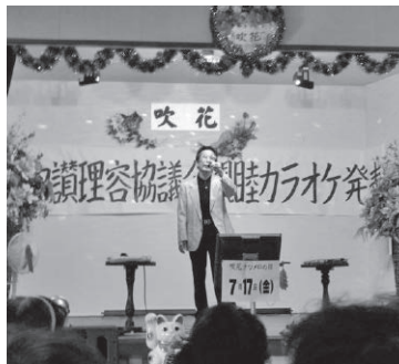
自慢の美声を披露

平成二十七年六月二十九日、午後十二時から、坂出の吹花にて、中讃カラオケ発表会が開催されました。今回は歌われる二十二人と応援の方々で、三十人を超える参加者があり、大変盛り上がりしました。みなさん、毎年この発表会を楽しみにされているようで、持ち歌を十分練習されていました。それにしても、みなさん大変お元気で、若手顔負けの音量と迫力、何時観ても圧倒されてしまいます。我々が、何年か後に、これほど仲間内で、和気藹々楽しめる趣味があるだろうか、少し羨ましくおもいました。 (県広報 白川成二)