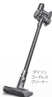
ダイソン コードレス クリーナー