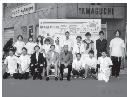
各部門の出場選手