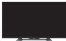
40V型 フルハイビジョン液晶テレビ