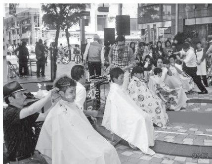
キッズヘアコンテスト会場(片原町)