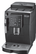
全自動エスプレッソマシン