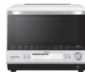
スチームオーブンレンジ