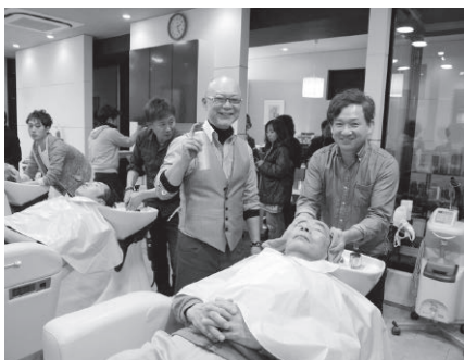
明るい今川講師(中央)で楽しく講習

震動器の使い方・アプローチの仕方等を教わり実技を实践した。依然と厳しい理容業の昨今、顧客に喜んでいただける立場に立ち、個店に合ったメニユーを展開する事こそ増収に繋がる一歩と感じた。会場は夜明けを感じ指す温かいムードに包まれていた。