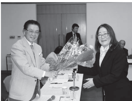
藤澤女性部長(右)より花束贈呈

全理連予算案では、組合員の減少な どで全体の予算額が一億四千万円あ まりの減額になることが報告された。 全理連クレジットカード加盟店制