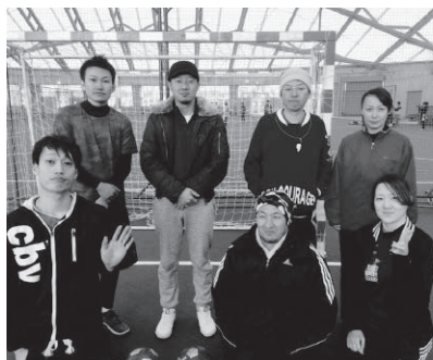
青年部出場メンバー

平成二十八年二月十五日に岡山県理容組合青年部主催で行なわれた、中国フットサル大会に参加して参りました。開催場所は岡山県北區にある『岡山ドーム』。香川県組合より八名の選手が『トリコズ・さぬき』と言うチームを作り参戦して参りました。戦歴ですが、香川県は六チーム中(二県は講習の為に不参加)六位と惨敗でしたが、参加した選手達は他県の選手とフラインド・サッカーや、ゆるゆるの体操などを一緒にを行い親交を深めたと思います。また、本県より参加した選手達は、他県の組合活動を見たり、他県の組合員と親交を持って刺激を受けた様です。(県青年部長 初瀬名史)