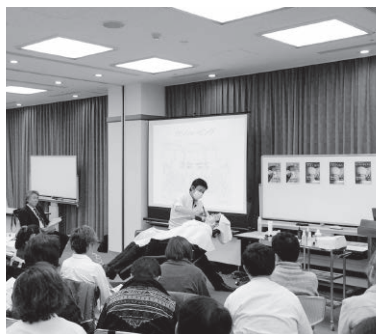
熱心に講習に見入る受講生

る方法を学べました。内容の濃い長時間の講習になったのと、難しかった認定試験で大勢の参加者が疲れた様子でしたが、その分、多くを持ち帰れた良い講習でした。