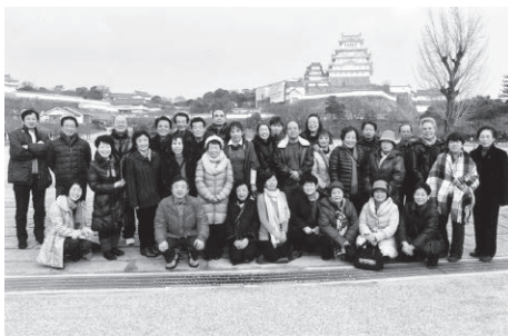
姫路城をバックにっこり