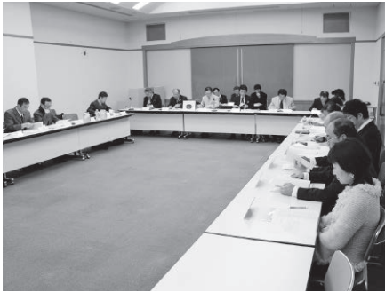
第5回理事会の様子

理美容所及び美容所に必要な衛生上 の要件を満たし、かつ、施設内で働く 施術者全員が理容師と美容師両方の