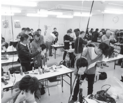
熱のこもった練習風景

媛県担当とし、全国大会出場が決定した選手を九月十二日召集して競技必勝に向けての最終特訓を予定しており、参加されている選手の奮起を期待するものであります。