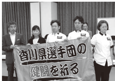
全国大会に出場する香川県選手団