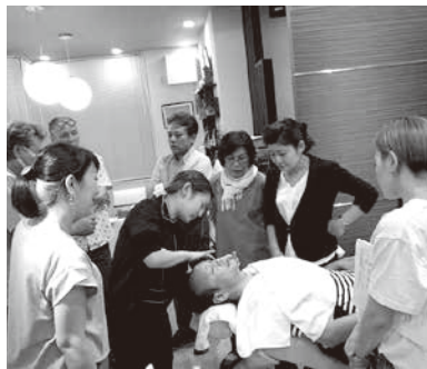
全員でフローシェービング体験中