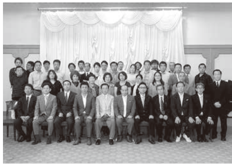
審議もスムーズに進行した東讃総会

れ、通常総会は閉会しました。続いて親睦会に入り、久しぶりに顔を合わせる組合員さん同士、和気藹々と親睦を深めておられました。最後に、また一年組合のために、組合員一丸となって、組合活動に従事していくことを確認し、楽しい一時を終えることができました。