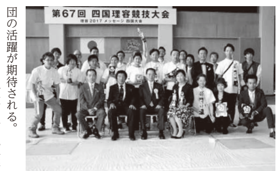
四国大会香川県選手団