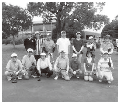
スタート前に記念写真