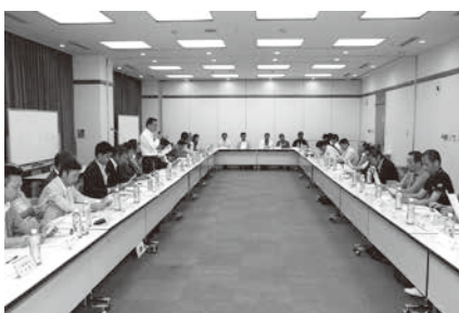
共済部長一同に会しての推進打合せ

式次第に沿って滞りなく無事周知徹底出来ました。今年は、団体生命小型の推進という今までは違って推進する側に軸足を置いた方法に変わったという事、そして、団体生命小型を推進するにあたっての注意点、特別給付金が組合員にとってどれほどお得な保険であるかの説明等を再度理解してもらった上で推進してもらうよう支部長並びに共済部長にお願いしました。尚、香川県におきましては、この度団体生命小型の推進と並行して「元氣キャンペーン」と銘打って4種類の共済を対象に1万