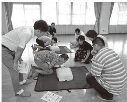
応急手当の実施模様

仏生山支部は七月三日(月) 午後五時より仏生山コミュニティセンターに於いて「救命処置」講習会を開催した。