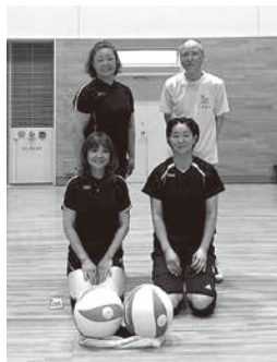
チームワークの勝利!