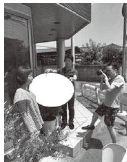
快調に製作が進む撮影風景

このたび県組合独自事業としてヘアメニユーカタログを発刊しました。県講師が主体となり、講師がそれぞれの得意分野に分かれ、キッズ、ジュニア(中高生)、ジュニア(高校生)、レディースの各スタイルを造り発表。それを小冊子にまとめ、ヘアカタログとして全組合員のお手元にお届けします。