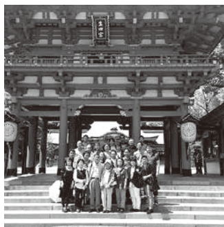
楽しいひと時 丸亀支部旅行