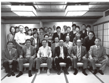
宴会前の集合写真