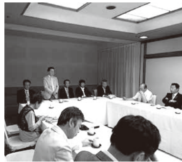
厳粛な雰囲気の中での中讃総会

れ、通常総会は閉会しました。続いて親睦会に入り、久しぶりに顔を合わせる組合員さん同士、和気藹々と親睦を深めておられました。最後に、また一年組合のために、組合員一丸となって、組合活動に従事していくことを確認し、楽しい一時を終えることができました。