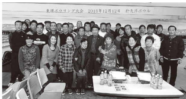
東讃ボウリング大会 2016年12月12日 於太洋ボウル