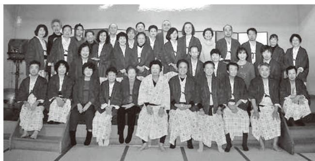
ホテルで記念写真

平成二十九年二月六、七日で、中讃協議会親睦旅行に参加しました。朝から好天に恵まれ、総勢三十六名の参加者は元氣一杯出発しました。目指すは九州別府、国東半島、バスは快調に走り続けます。佐多岬の三崎よりフェリーで佐賀関に渡りまして。豊後水道は瀬戸内海と違ってやはり波が高く、船酔いされた方も少々いましたが、無事九州に上陸。最初の観光地白杵石仏へ。ここでは見事に彫られた石仏と、のどかな風景に癒されました。その後、別府温