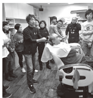
丁寧な技術指導の宝智講師