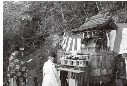
髪授神祠大祭の様子