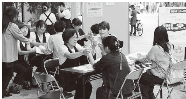
大人気ハンドマッサージ体験