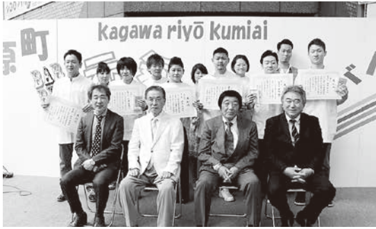
出場選手らと記念写真

ボリューム感、フィット感がよく、とても良い雰囲気でした。マージュの特徴をよくとらえていました。