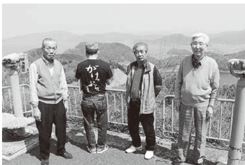
東尋坊で記念写真

これからが本番。少し早目に宿に到着し、北陸の名湯で疲れた体を癒したのち、香北総会がスタート。二十九年年度経過報告から始まり、会計報告、予算審議も滞りなく全会一致で可決され、お待ちかねの香北名物大宴会に突入。おいしい料理とお酒を味わいながらカラオケあり、卓球ありの芦原の夜は更けていくのであります。