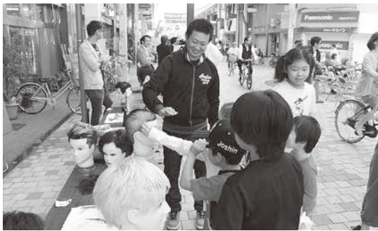
ちびっこ手バリに挑戦