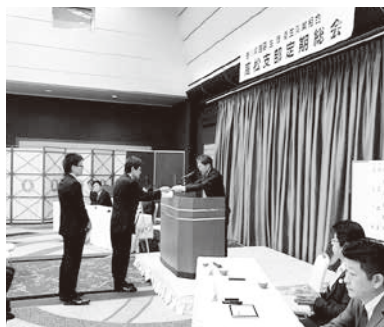
高松支部総会風景