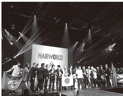
世界大会で念願の表彰式

広さに圧倒されつつ負けじと応援します。シニアチームの競技が始まる前にホテルに帰りました練習、トレナーの助言を実行してみます。中々いい調子。明日はこれで行く！ 本番当日、決戦の日が来ました！準備万端です。競技場に入場するまで自分の番号が分かりません。ロープの中に入る時に日本チームの番号が載ったペーパーを見せてくれます。私は九十三番、ちょっと奥の方です。クランプ装着OK、水をかけるとの指示、軽くスプレーしていたところ、ジュリィがやって来て後ろに下がれと言われます。その後ジュリィが水スプレーをぶん取り、水をかけるかける。ズブズブにした後オールバックに梳かされました。ここで私の大会は終わったのも同然です。山羊の