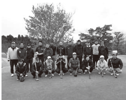
参加者の皆さんと記念写真