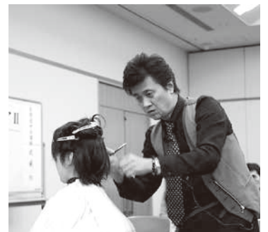
武蔵均全理連中央講師

曜の営業にも差し支え、これは明日の旅行が思いやられるなど半ば覚悟をしていましたが、組合員さんの日ごろの行いが余程良いのか、はたまた脅威の晴れ男女が参加しているためか、当日は快晴！男女合計四十名で元気に出発しました。 行き先は愛知三河湾めぐりからの、長良川鉄道で美濃市まで行き、そこから滋賀を通っての行程。しかし今回の旅行は時間的にも、内容的にもハードな結果となりました。途中の観光地は花の時期は外れ、強風の恋路ヶ浜は歩くのがやっとな、渋滞にはまり、ホテルに着くと同時に着替える暇もなく夕食。フロアには暖房が入っていないし散々でした。 まあ長く旅行をしているとこんな年もありますね。途中のバスではビンゴゲームが、たいへん盛り上がり、後ろの方は酒が次々に空いていきます。幸いにも天気に恵まれ、大きな事故もなく、まあ来年も元気で来ようねとみんなで約束して、一泊二日の旅行を終えました。