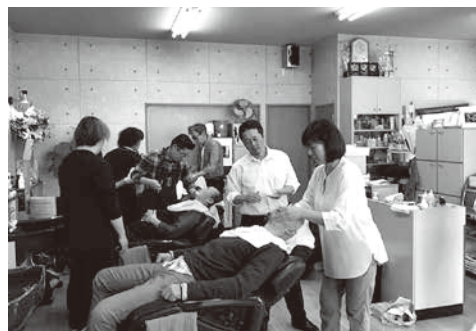
日本剃刀での顔剃りの実習の様子

同士で日本剃刀での顔剃りの体験実習をした。続いて研磨に入り各自が剃刀の研磨をした。