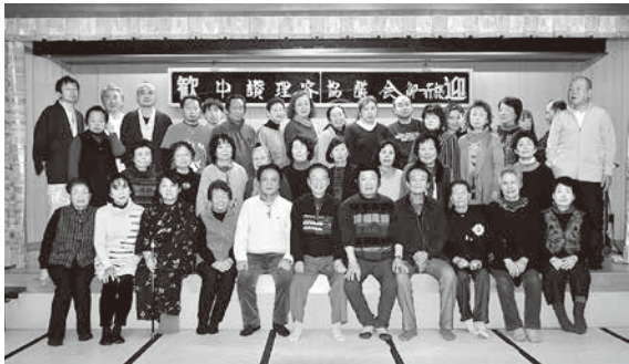
みんなで記念写真

平成三十年二月五、六日に、中讃協議会は親睦旅行を行いました。前日の四日は香川も大変な大雪で、日